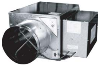
SDx 型单风道变风量末端装置